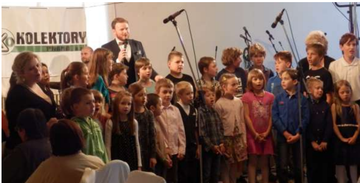
1. třída a 5. třída